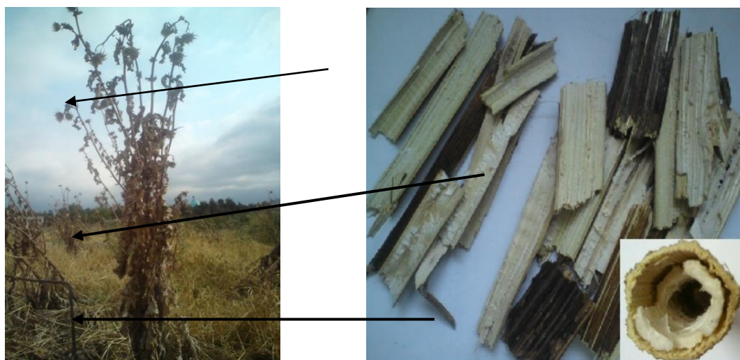
شکل ۲- گیاه مارتیغال