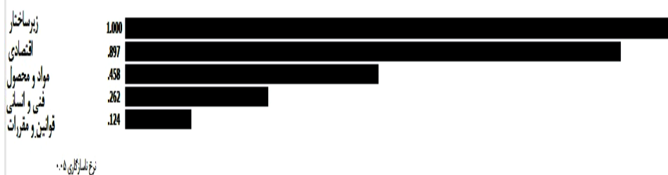
شکل ۲- ارزش وزنی شاخه‌های سطح نخست درختواره تصمیم‌گیری